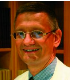
Ordination Aignerstrasse 12